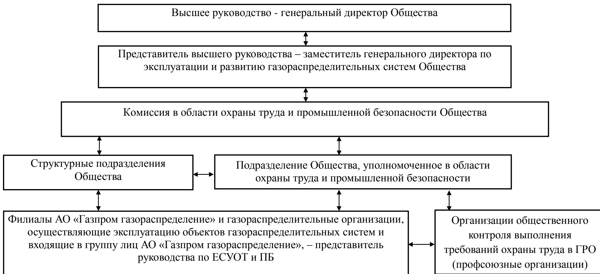
Схема структуры Единой системы управления охраной труда и промышленной безопасностью в АО «Газпром газораспределение»